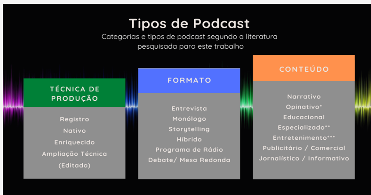
Figura 1 – Categorização do Podcast

Carneiro e Rocha (2022) elaboraram uma categorização visual acerca do Podcast , com relação à técnica de produção, formato e conteúdo (Fig. 1):