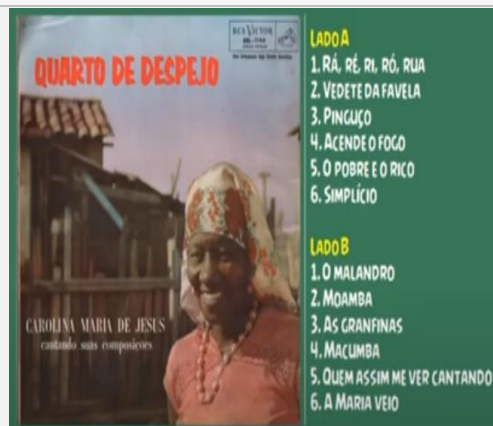
Carolina Maria de Jesus, em 1961.